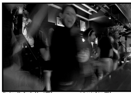
Chez Georgette - Bruxelles - 14 avril 2012 2012